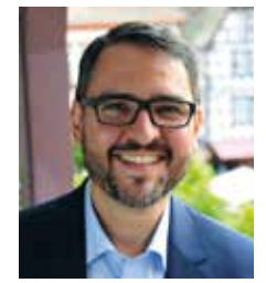
Marc Weigel Oberbürgermeister der Stadt Neustadt an der Weinstraße