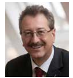
Manfred Sutter Oberkirchenrat der Ev. Kirche der Pfalz

Der „Neustadter OrgelSommer“ ist eine Veranstaltungsreihe des Protestantischen Dekanats Neustadt in Kooperation mit dem Kulturamt Neustadt an der Weinstraße.