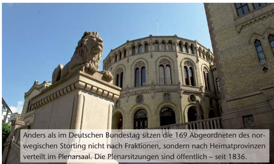
Anders als im Deutschen Bundestag sitzen die 169 Abgeordneten des norwegischen Storting nicht nach Fraktionen, sondern nach Heimatprovinzen verteilt im Plenarsaal. Die Plenarsitzungen sind öffentlich – seit 1836.