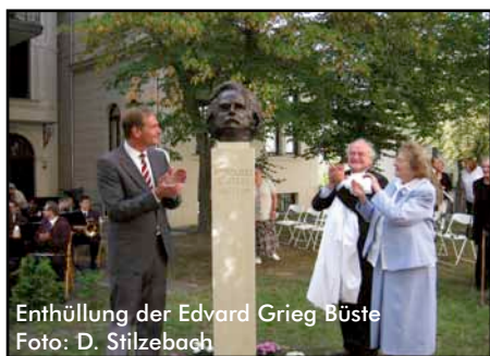
Enthüllung der Edvard Grieg Büste