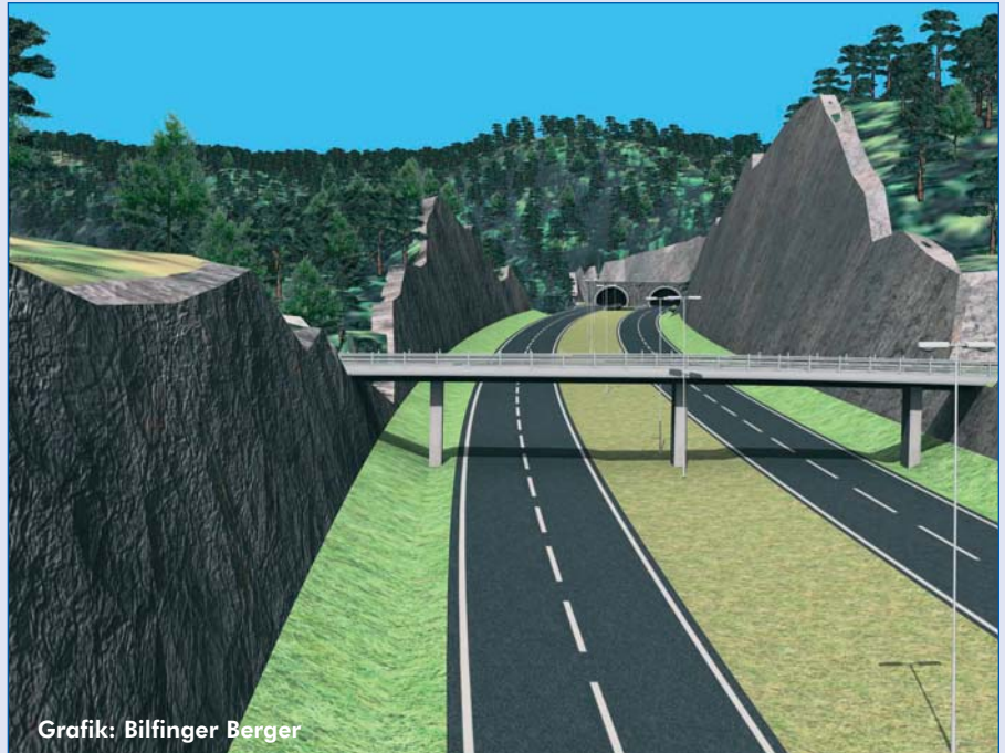
Grafik: Bilfinger Berger

Ein Konsortium unter der Führung des deutschen Konzerns Bilfinger Berger hat den Zuschlag zur Errichtung eines neuen Autobahnteilstücks auf der Linie Kristiansand - Oslo erhalten. Die 38 km lange Strecke entsteht einschließlich zahlreicher Sonderbauwerke wie Brücken und 7 Tunneln mit einer Gesamtlänge von rund 6 km. Es ist das erste privatwirtschaftliche Betreiberprojekt des Konzerns in Skandinavien, denn nach dem Bau der Straße übernimmt die Projektgesellschaft den Betrieb und die Instandhaltung dieses Straßenstücks für 25 Jahre gegen festes Entgelt durch den norwegischen Staat. Das voraussichtliche Investitionsvolumen des Projektes beträgt ca. 450 Millionen Euro. Die Fertigstellung ist für den 31.08.2009 geplant.