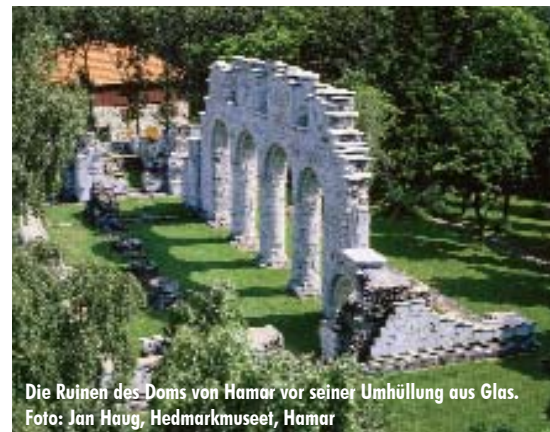
Die Ruinen des Doms von Hamar vor seiner Umhüllung aus Glas.