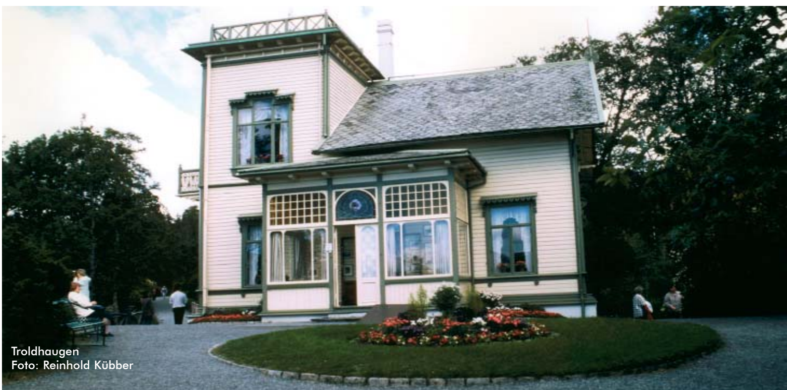
Troldhaugen